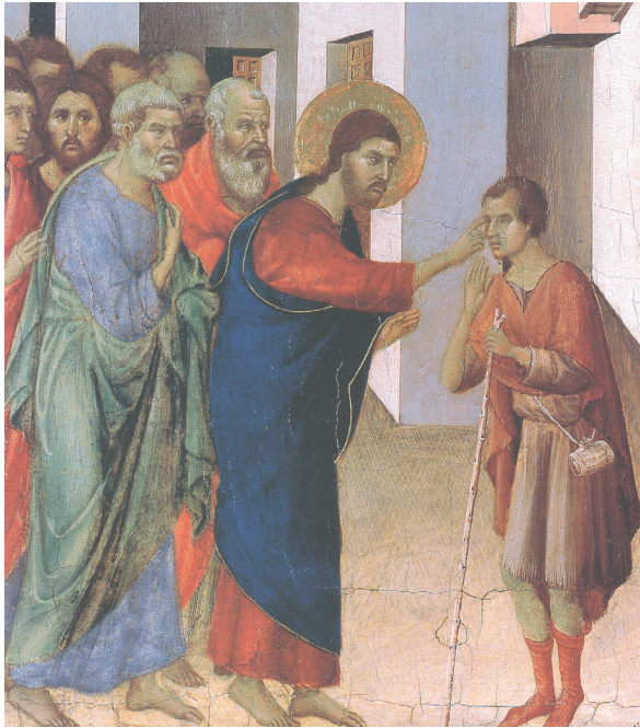
Healing the Blind Man (detail), Duccio di Buoninsegna (1308-1311)